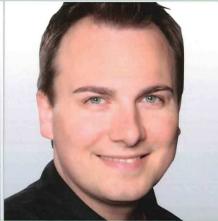
TIM RAUE „RESTAURANT TIM RAUE“